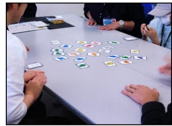
「本で楽しむボードゲーム」