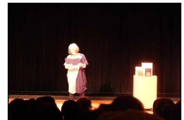
「語りのおはなし会」