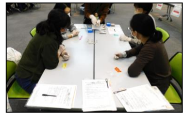
「本で楽しむボードゲーム」