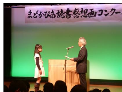
「読書感想画コンクール表彰式」