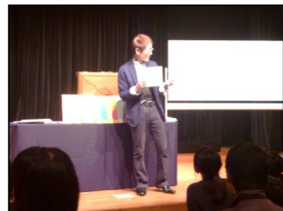
「とよたかずひこ講演会」