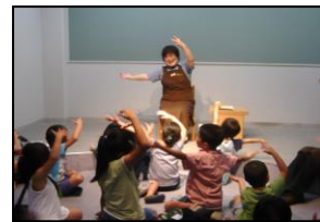
「わくわくおはなし会」