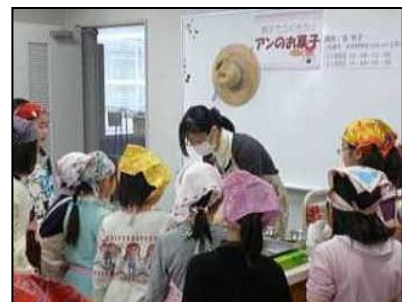
「親子でつくろう！アンのお菓子」