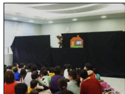
「わくわくおはなしまつり」