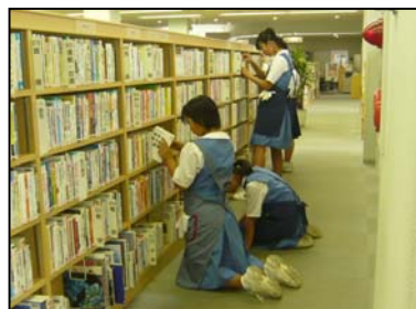
「太宰府中学校体験学習」