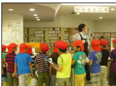
「大野南小学校社会科見学」