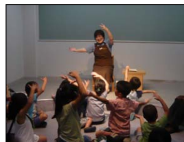
「わくわくおはなし会(小学生以上対象)」