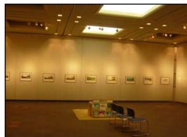
「遠野昔話絵本原画展」