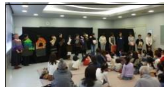
「わくわくおはなしまつり」