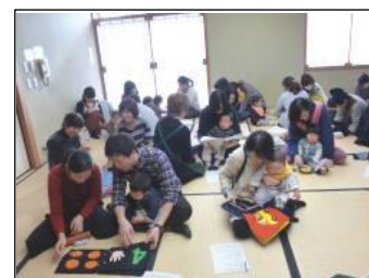
「あかちゃんと布のえほんであそぼう」