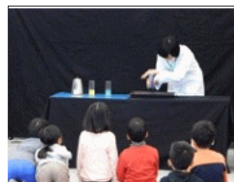
「サイエンスショー&科学工作 科学とあそぼう」