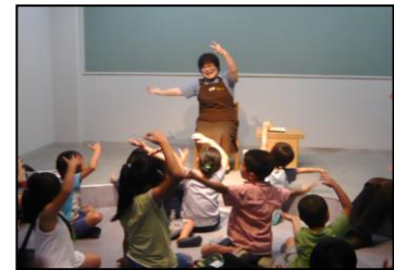
「わくわくおはなし会」